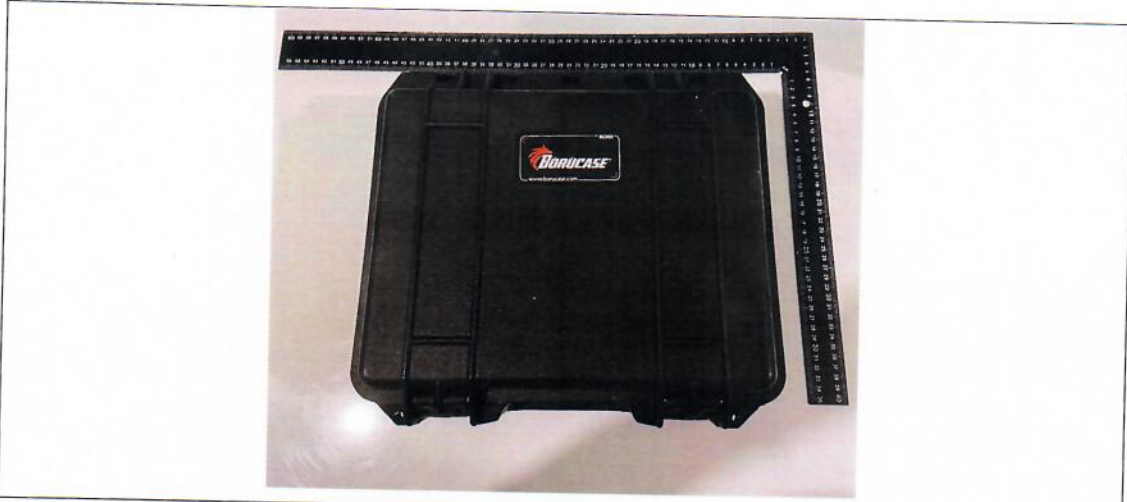
Ürün fotoğrafı 1 / Product photo 1