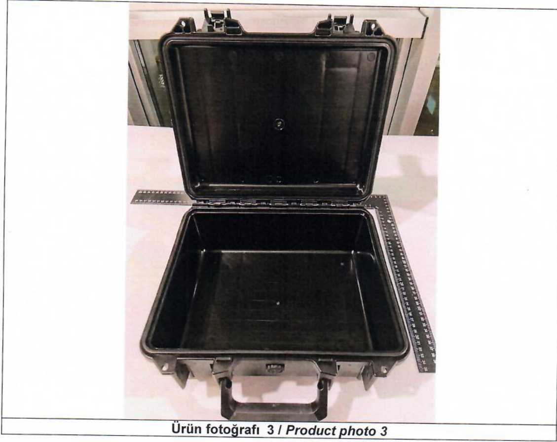
Ürün fotoğrafı 3 / Product photo 3