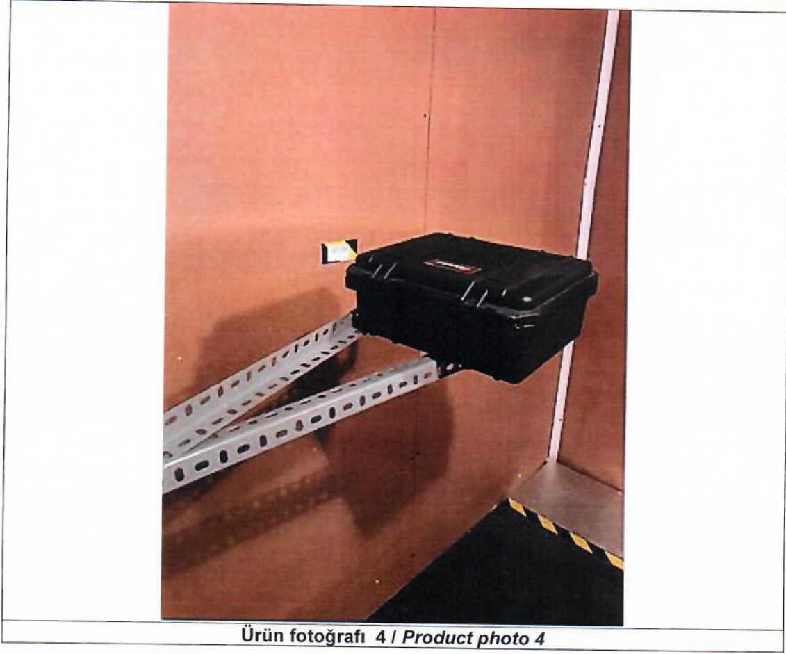
Ürün fotoğrafı 4 / Product photo 4